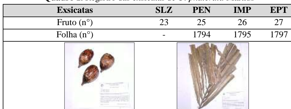
Quadro 1. Registro das exsicatas de O. phalerata Martius

Legenda: SLZ: São Luís; PEN: Penalva; IMP: Imperatriz; EPT: Esperantinópolis.